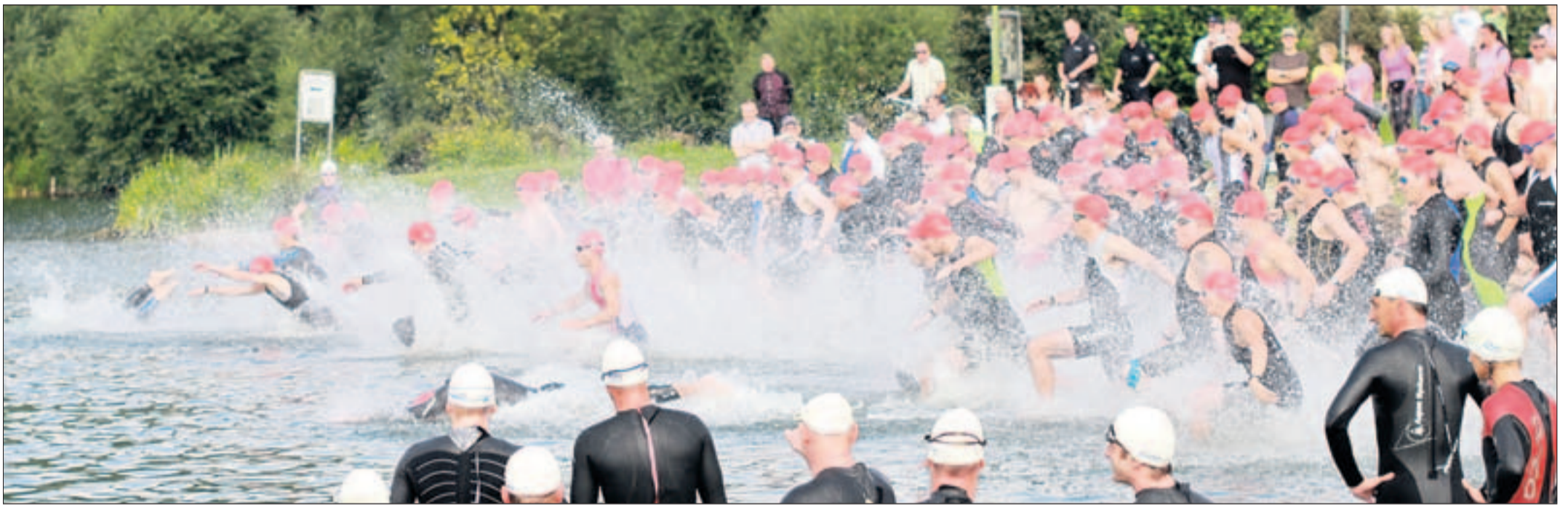
Beobachtet von der zweiten Startgruppe (weiße Badekappen) stürmt die erste Gruppe in der Reppnerschen Bucht zum Schwimmen.

299 Teilnehmer kämpften gestern im und um den Salzgittersee um den Sieg beim Triathlon. Den Sieg machten die auswärtigen Gäste in einem spannenden Duell unter sich aus.